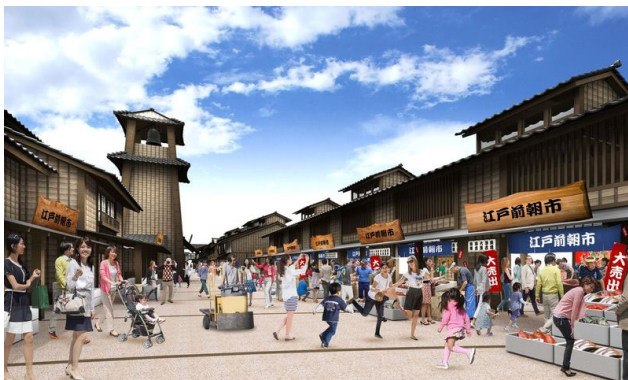
【商業棟2階イメージ】