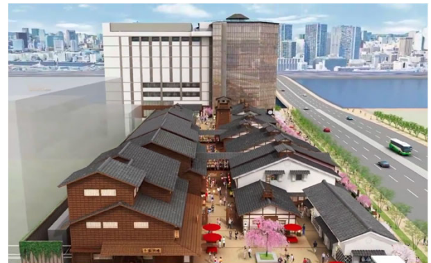
【商業棟上空よりイメージ】