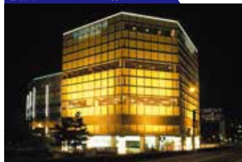
横浜みなとみらい館

〒410-0011 静岡県沼津市岡宮1208-1 TEL.055-927-4126(代) FAX.055-926-8000 mail : numazu@manyo.co.jp URL https://www.manyo.co.jp/numazu/ 【2004年 3月 1日オープン】