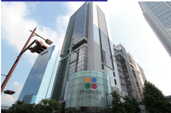
プロメナ神戸館(9号館)

〒231-0001 神奈川県横浜市中区新港2-7-1 TEL.0570-07-4126(代) FAX.045-671-1188 mail : minato-mirai@manyo.co.jp URL https://www.manyo.co.jp/mm21/ 【2005年 6月 25日オープン】