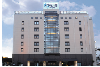
東京・町田館(1号館)

万葉倶楽部は「上質の温泉・食・憩い」を提供する万葉の湯を中心とした創造性ゆたかな施設を全国に展開しております。