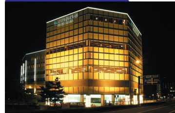
横浜みなとみらい館(8号館)

〒410-0011 静岡県沼津市岡宮1208-1 TEL.055-927-4126(代) FAX.055-926-8000 mail : numazu@manyo.co.jp URL https://www.manyo.co.jp/numazu/ 【2004年 3月 1日オープン】